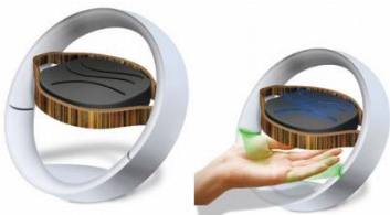
※図はデザインイメージの 1 例です。