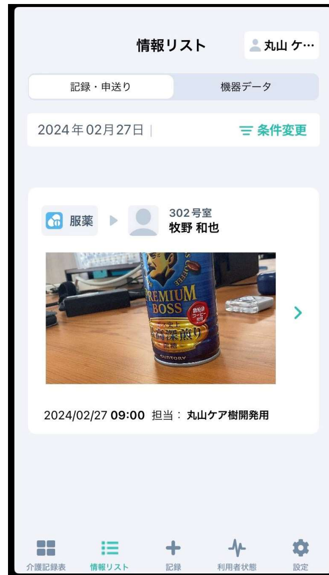
写真付き介護記録のイメージ